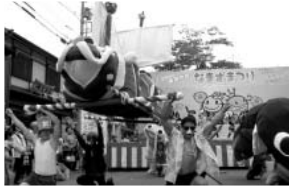
昨年の優勝みこし(羽島市民プール ハートビート)