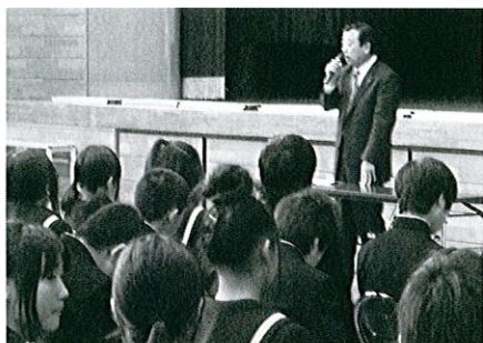
社会人講師授業の様子

キャリア教育事業は、学校教育の中で、子供たちの発達段階に応じて職業観を醸成し、将来の羽島市を担う人材を育成する目的で、平成17年度から実施しています。 昨年度は、社会人講師授業67回、小学校の職場見学790名、中学校の職場見学487名、羽島高校のインターンシップ12名に支援・協力し、また、ものづくりの観点からロボット製作授業と成果発表会を実施しました。 23年度も同様に、実施していきます。 社会人講師授業の講師、職場体験学習・インターンシップの受け入れにご協力いただける企業の方は、当所へご連絡ください。