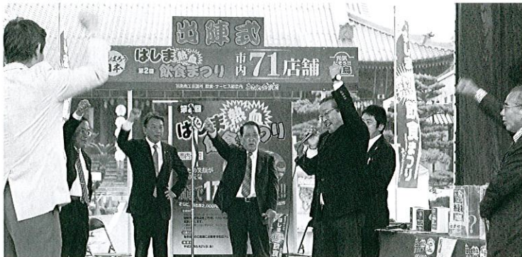
熱血飲食祭りの成功を願う参加者一同

〒501-6241 岐阜県羽島市竹鼻町2635番地 TEL(058)392-9664 FAX(058)392-6708 E-mail info@hashima-cci.or.jp URL: http://www.hashima-cci.or.jp