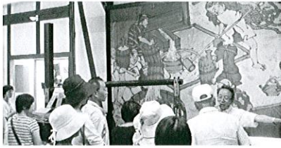
月桂冠大倉記念館での研修の様子