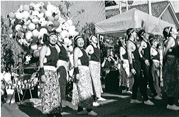
大人みこしで優勝した大和チームとみこし

イベントである創作みこしコンクールは、大人みこし11チームが参加しました。それぞれが優勝賞金30万円を目指して、なますみこし・パフォーマンス・衣装に工夫を凝らし、競い合いました。 優勝は、大和チーム。ステージ前では、熱気溢れるソーラン踊りを披露。 最後に、黒色のなますみこしから色とりどりの風船で出来た子なますを取り出すパフォーマンスを見せ、観客をあっと驚かせていました。