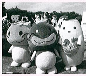
全国から32体のゆるキャラが参加 たけちゃんの生まれた木曾川で開催

10月22日(土)、23日(日)20 11美濃竹鼻なまずまつり で子供たちによる地産品 PR紙芝居を披露。特設ブ ースでは、新開発のなまず カレーパンを販売。なまず に似せた竹炭入りの黒いパ ンは、大好評につき完売と なりました。