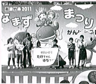
それいけ! たけちゃん(なちゃん)紙芝居で地産品のPR 大好評だったなまずカレーパン▲

10月22日(土)、23日(日)20 11美濃竹鼻なまずまつり で子供たちによる地産品 PR紙芝居を披露。特設ブ ースでは、新開発のなまず カレーパンを販売。なまず に似せた竹炭入りの黒いパ ンは、大好評につき完売と なりました。