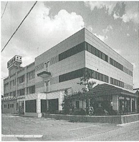
森白製菓株 代表者 森 義雄