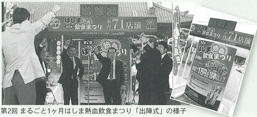
第2回 まるごと1ヶ月はしま熱血飲食まつり「出陣式」の様子