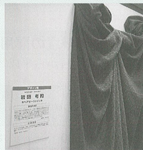
ジャパン・テキスタイル・コンテスト2011 デザイン賞を受賞

創業当時は、今よりは単純なデザインの高品質に提供することでよかったのが、今では、『1年前にデザインしたものが、流行後れになる程、スピードが速く、若い感性で新しいものをアピールし続けるこ