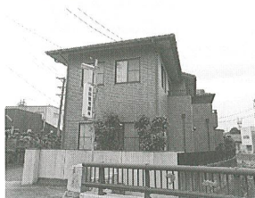
岩田健毛織株式会社 代表者 岩田 考司