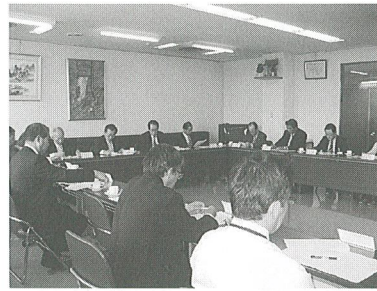
キャリア教育事業協議会の様子

この意見が出されました。商工会議所では、24年度も引き続き市内の小学校・中学校・高校で行われる授業等に支援をしまいいります。