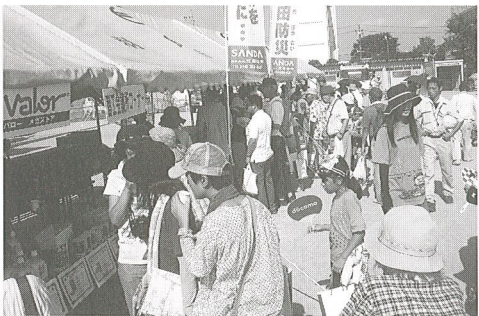
防災グッズコーナーの様子

優れた機能が盛り込まれた防災グッズを日常から用意することで、家庭の防災意識の向上に繋がります。