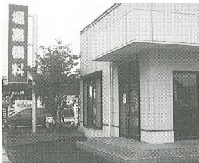
堀嘉機料 代表者 堀 博史