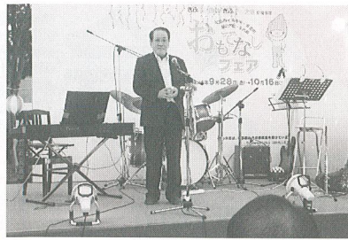
おもてなしフェア交流会のようす

9月28日(金)から10月16日(火)まで、ぎふ清流国体・ぎふ清流大会応援事業JR岐阜羽島駅前おもてなしフェアを開催しました。羽島市・海津市・養老町・輪之内町・安八町の協力を得、各市町合同の観光案内や名産品の販売、グルメコーナーなどを行いました。開催期間中は天候にも恵まれ、特にトラブルもなく終了することができました。このイベントを機に、各市町との連携がより一層深まり、様々な活動への発展へとつながっていくものご期待します。