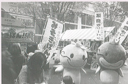
東京でも人気者? たけちゃん&はなちゃん