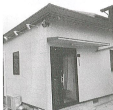
MAKABAYAN CO., LTD.