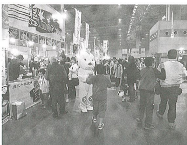
絶品 超満腹帝国 vol.8 in インテックス大阪

最近では、グルメによる地域振興が盛んになっていて、羽島市でもレンコン料理・和菓子など模索が続いているところ、その参考になりました。