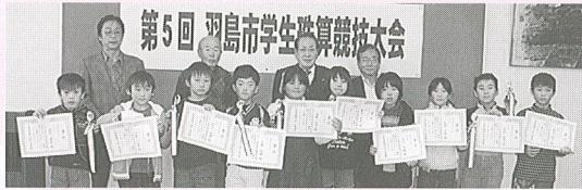
4年生以下の部 入賞者の皆さん