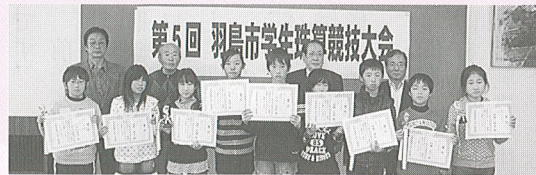
5・6年生の部 入賞者の皆さん