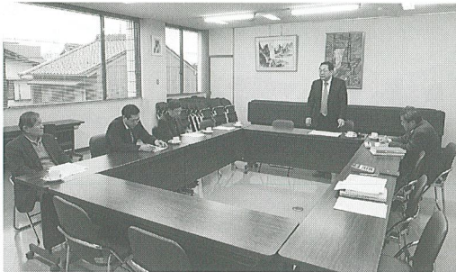
総務・財政委員会の様子