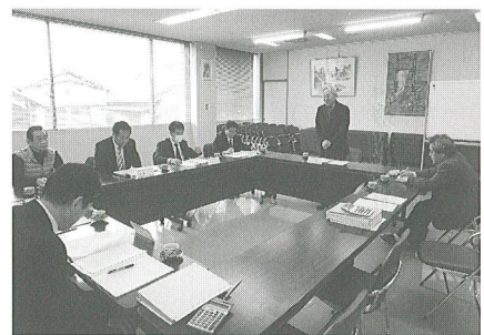
羽島プレミアム付商品券事業特別委員会の様子

2月5日（火）開催の当事業特別委員会、2月13日（水）開催の当事業協議会にて、未使用、未換金分の