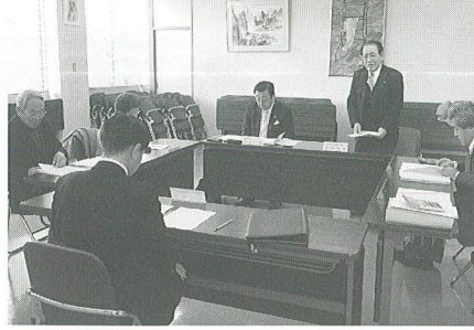
羽島プレミアム付商品券事業協議会の様子