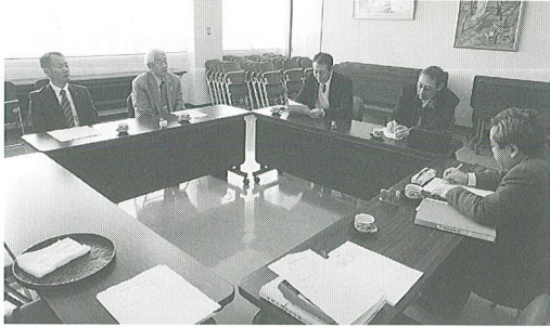
事業企画委員会の様子