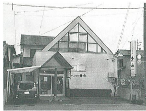
有フォトスタジオ青山 代表者 青山剛三