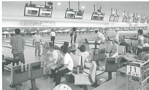
ボウリング大会の様子

ボウリングは、年齢、性別を問わず、誰でも気軽に参加できるスポーツです。皆様の次回の参加をお待ちしております。