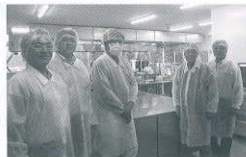
官民連携支援施設「ながとらポ」見学

ンドの創出や、域外への販路拡大も視野に入れた事業展開を後押ししています。続いて連携企業の代表としてフジミツ株を見学。域