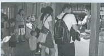
民家を改造したスターバックスの店内(清水寺付近)

当市においても、外国人観光客の消費を取り込む事が重要であること事を実感しました。